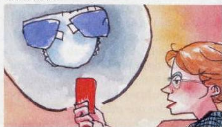
ILUSTRACIÓN: ELISA BIETE JOSA